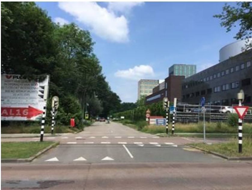
Ingang naar de parkeerplaats

Parkeren aan de achterkant van het gebouw.